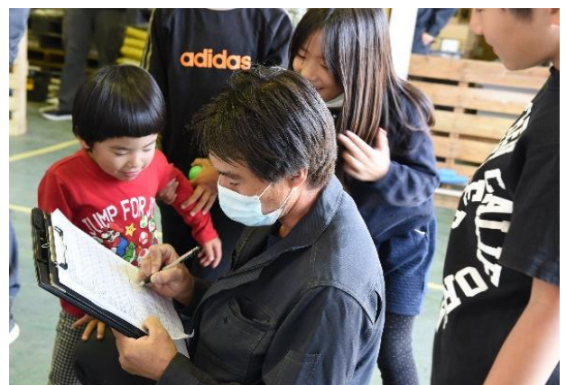
子供達に話しかけられながら審査する社員の様子

人手不足に悩まされる建設業界では少子高齢化による若手労働者の減少で人手不足に陥るケースもありますが、建設業界に興味をもつ若者離れも大きな要因の一つです。当社では職人の魅力や仕事に憧れを感じてもらうために、若者が建設業に触れる機会を増やしていきたいと考え、今回の職人選手権では来場の子供達が職人体験をできるスペースを設けています。実際にエコキュートの組み立て作業で使用する糊付けや、銅管をカットする作業、ボルトやねじ締めなどを職人が傍でサポートしながら体験をすることが出来ます。今後は